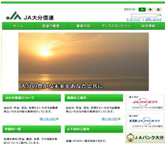
JA大分信連のホームページ https://www.jabank-oita.or.jp/sinren/