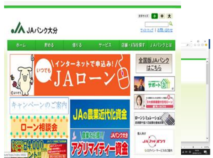
JAバンク大分のホームページ https://www.jabank-oita.or.jp/